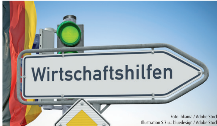
Foto: hkama / Adobe Stock Illustration S.7 u.: bluedesign / Adobe Stock

So hat das Bundesfinanzministerium (BMF) die bislang schon geltenden steuerlichen Verfahrenserleichterungen aufgrund der anhaltenden Pandemie noch einmal verlängert. Wie schon in der Vergangenheit können die von der Pandemie nachweislich unmittelbar und nicht unerheblich negativ wirtschaftlich Betroffenen u.a. von Anpassungen der Steuervorauszahlungen profitieren (BMF-Schreiben vom 7. Dezember 2021, Gz. IV A 3 – S 0336/20/10001 :045).